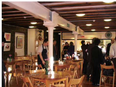
社会的企業が運営する障害者の就業訓練を行うカフェの様子(イギリス)

社会的経済の担い手の範囲は広く、その活躍の分野も農業や環境から福祉、教育に至るまで多様である。では、具体的な内容は何か。ボランティア活動の