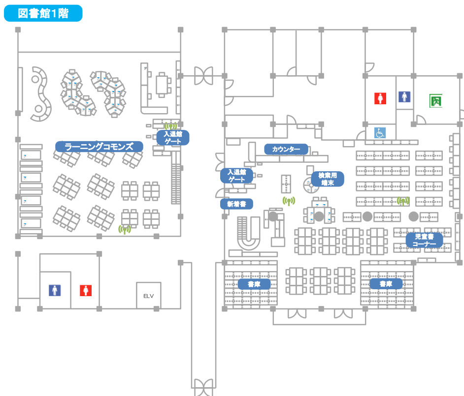
閲覧室 1F・ラーニングcommons平面図